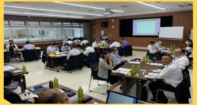
『マネジメント基礎研修』(2023.9)