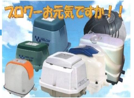
ブローセルフチェック