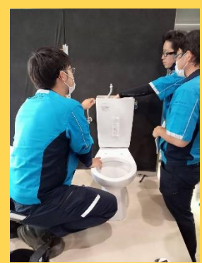
関連企業との技術勉強会 (2023.8)